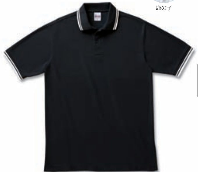
501 ブラック (xホワイト)