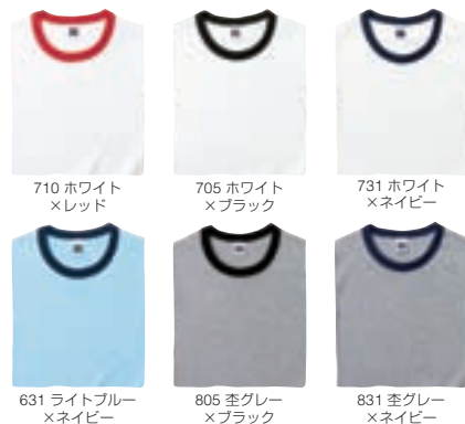
710 ホワイト ×レッド