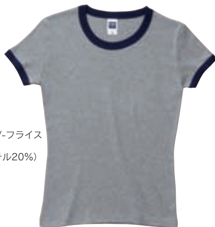
831 空グレー×ネイビー