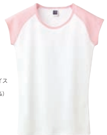
711 ホワイト×ライトピンク