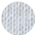
レーヨン混天竺 独特の光沢感と 風合いの良い天竺