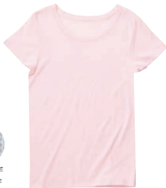
411 sherbet pink