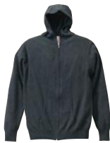
530 ミックスチャコール